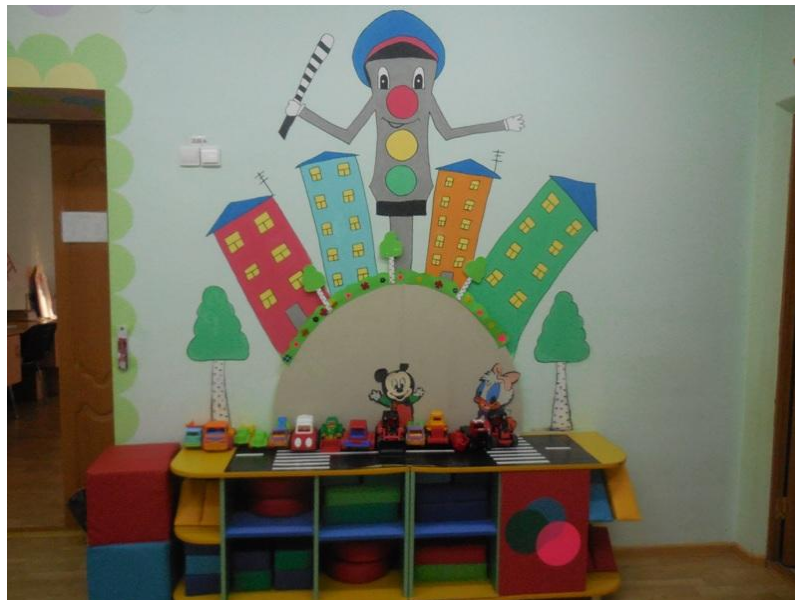
Территория детского сада