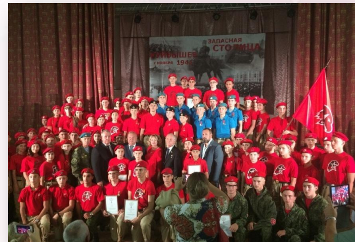
Подведение итогов первой военно-патриотической смены «Юнармеец»