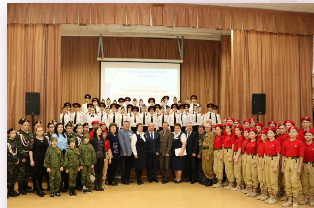
Открытие стажерской площадки «Современные подходы к гражданско-патриотическому воспитанию обучающихся»