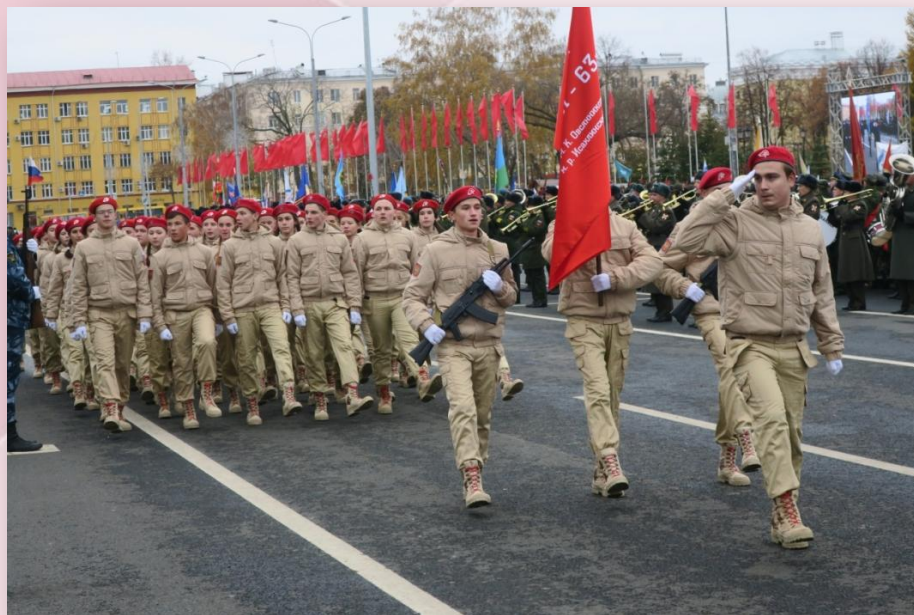
Смотр парадных расчетов «Марш Устинова»