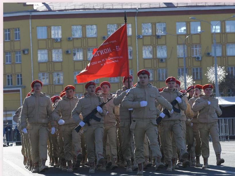
Парад Памяти посвященный военному параду 7 ноября 1941 года в г. Куйбышеве