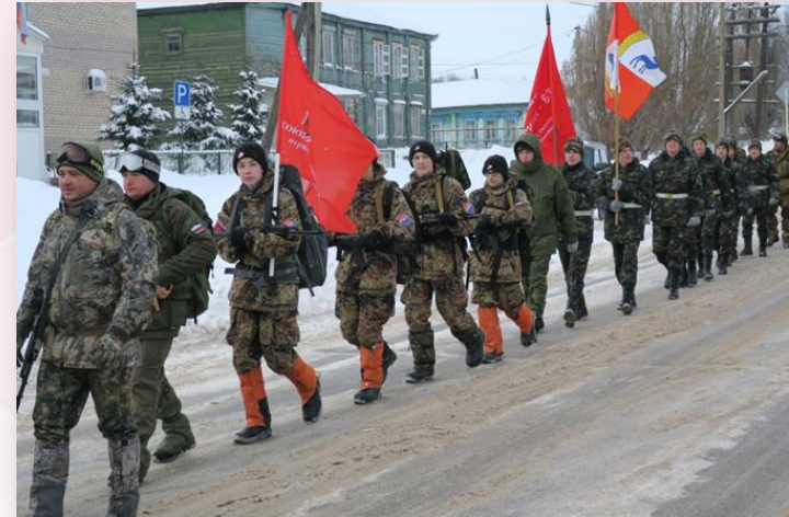
Марш-бросок «Версты Памяти»