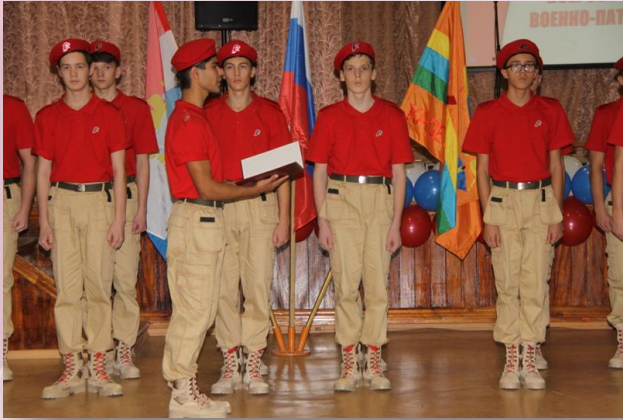
Торжественная церемония присяги Юнармейцев