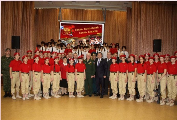
Ежегодная акция «Связь поколений-связь времен»