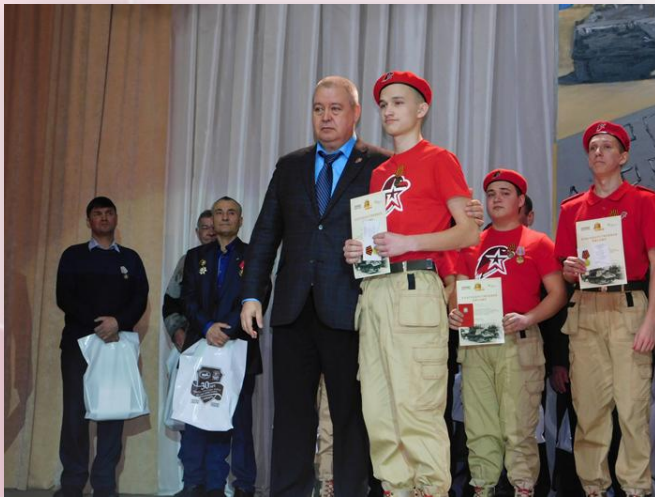
Вручение Благодарственных писем и нагрудных памятных знаков