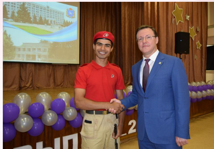
Юнармейцы встречают губернатора