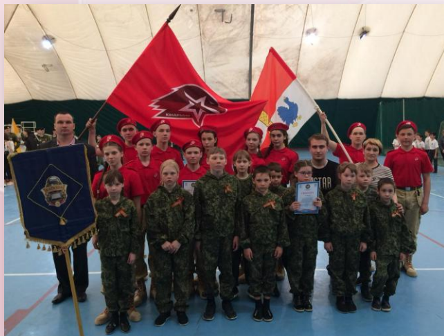
Зональный этап военно- спортивной игры «Зарница»