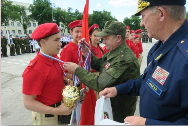
Зарница Поволжья п.Рощинский