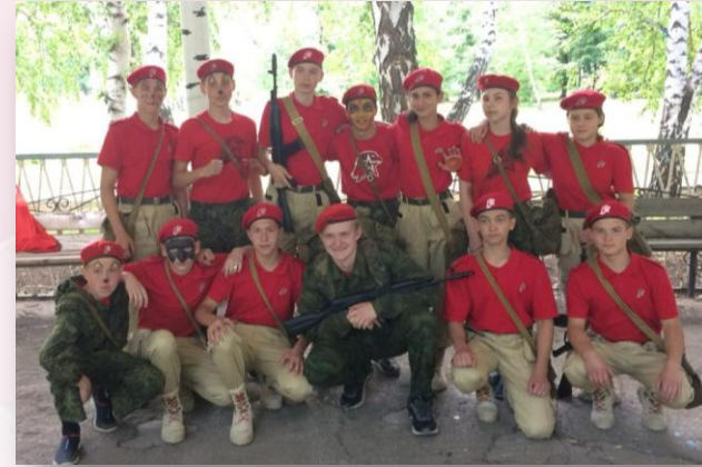
Первая военно-патриотическая смена «Юнармеец»