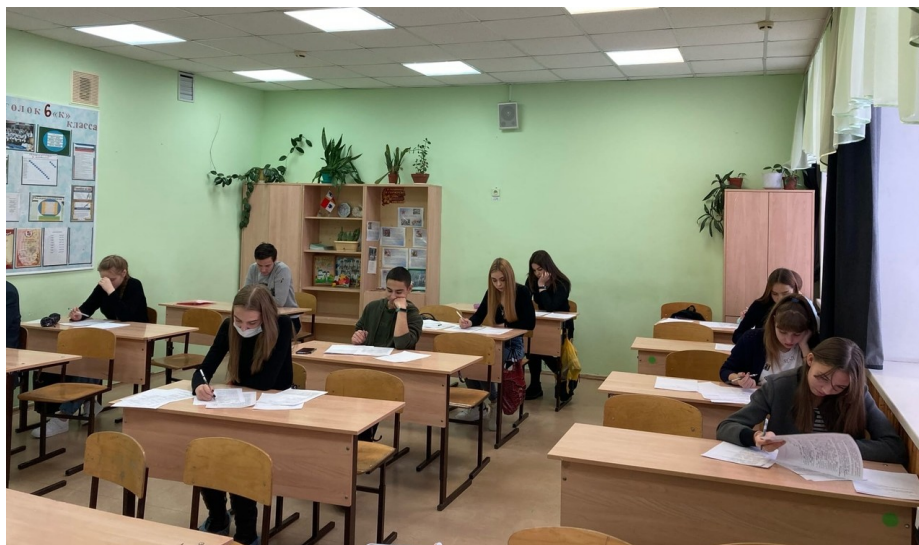
Окружной этап предметных Олимпиад-2020