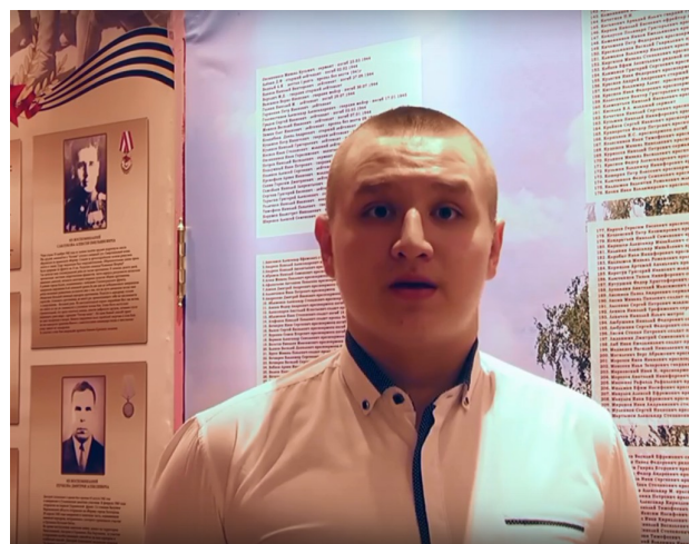
Конкурс Чтецов, посвященный военному Параду 7 ноября 1941 года в г. Куйбышеве.