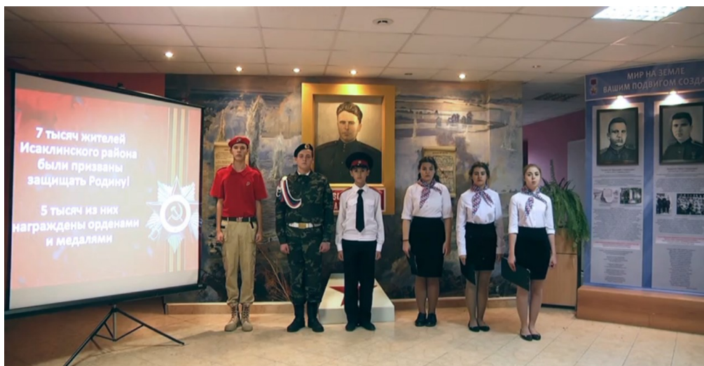
Активисты школьного музея «Наследие» стали победителями окружного этапа агидбригад и участниками областного конкурса детского творчества посвященного запасной столице СССР в г.Куйбышеве