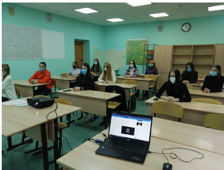
Участие в областных онлайн-творческих сборах «На волне»